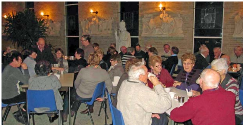
Veel actieve vrijwilligers in de Clemenskerk te Gerwen

Al vele jaren is het een goede traditie dat er binnen de St.Clemensparochie te Gerwen een vrijwilligersavond wordt gehouden. Ook in 2012 dus. Op donderdag 12 januari jl was het zover: