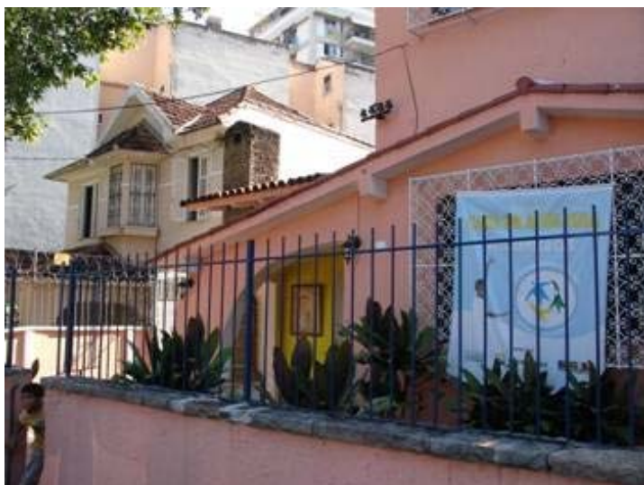
Casa Frei Carmelo Cox