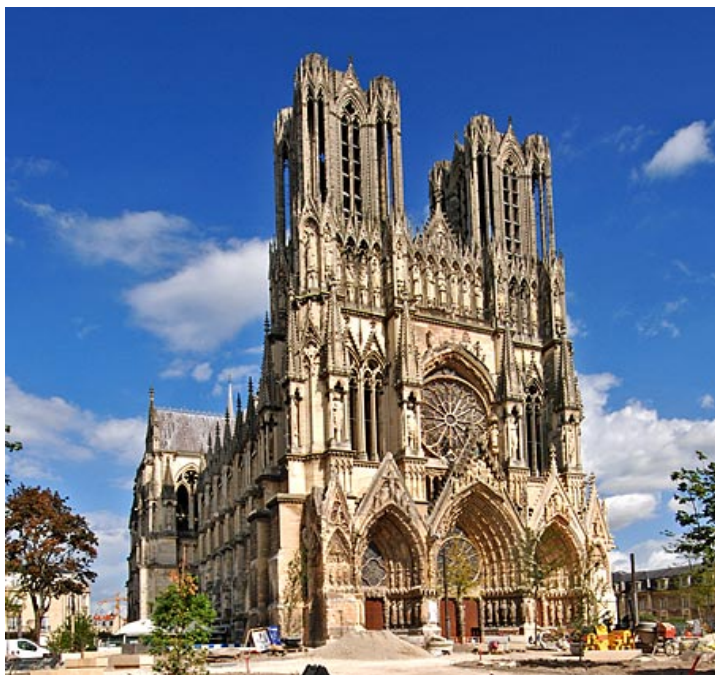
De Notre Dame van Reims

Op dinsdag 18 september uur vertrekken we uit Nuenen voor een bezoek aan Reims.