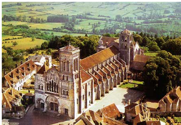
De Basilique St.Madeleine, boven op de heuvel van Vezelay

Op zaterdag gaan we naar Paray-le-Monial. De Basilique du Sacré-Coeur, gewijd aan de verering van het Heilige Hart van Jezus, heeft van deze plaats een van de belangrijkste bedevaartsoorden in Frankrijk gemaakt. De kerk is een kleine versie van de verloren gegane kloosterkerk van Cluny. Overnachting en diner weer in Chalons-sur-Saone.