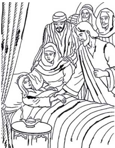
De dochter van Jairus

van de manier waarop wij onze handen gebruiken. Welke aanrakingen we prettig vinden en welke niet. Wie we een hand geven en wie liever niet. Wat we maken en wat we breken met onze handen. Waarom we het ene oppakken terwijl we het andere laten liggen. En wat we aanmoeten met die momenten, dat we de dingen uit handen moeten geven. Omdat je een